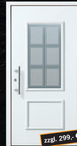
Fischbach - 1 PP G05 * RAL 9016, Griff 03040011/S400 (beidseitig mit Decor-Rahmen)