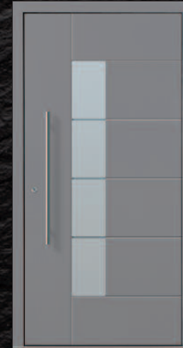
Kirrweiler - 1 KK G08 RAL 9007, Griff 03040011/G800