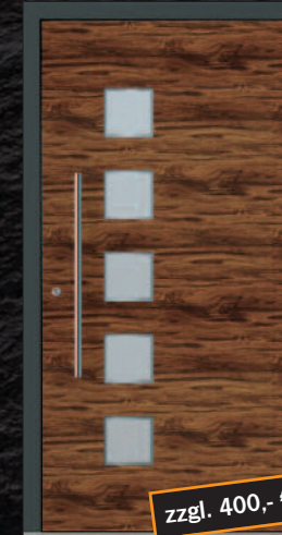
Rülzheim - 1 KK G03 RAL 7016, außen „rustikal“ Griff 03040011/G800