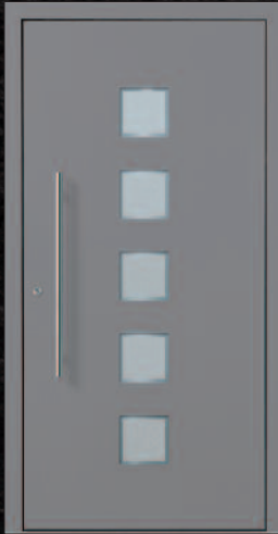
Hauenstein - 1 KK G03 RAL 9007, Griff 03040011/G800