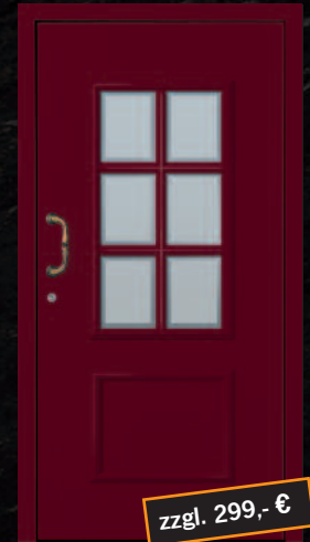
Marxzell - 3 PP G02 * RAL 3005, Griff 83314002 (beidseitig mit Decor-Rahmen)