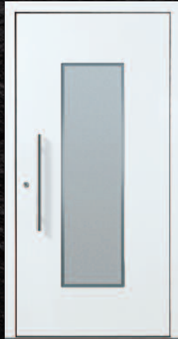
Frankweiler - 1 KK G10 RAL 9016, Griff 03040011/G600