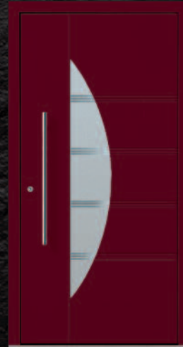
Wachenheim - 1 KK G04 RAL 3005, Griff 03040011/G800