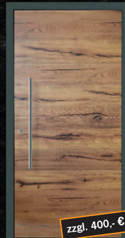
Großheim DB 703, außen „alpin“ Griff 03040011/G800