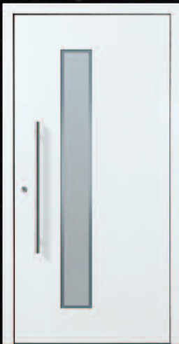
Rohrbach - 1 KK G03 RAL 9016, Griff 03040011/G800