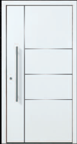
Jockgrim - 1 RAL 9016, Griff 03040011/G800