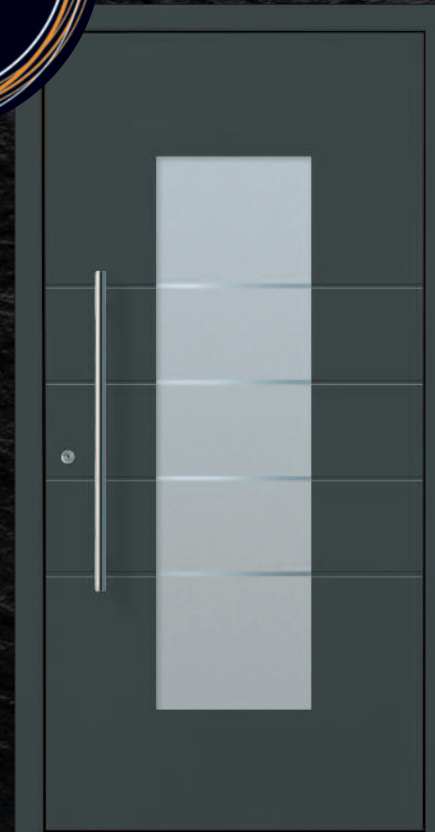
Modell Dierbach - 1 KK G08

Seitenteile sind optional für jede Haustür gegen Mehrpreis lieferbar.