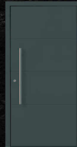
Großheim DB703, Griff 03040011/G800