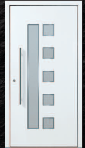
Beuren - 1 KK G03 RAL 9016, Griff 03040011/G800