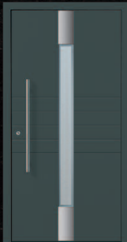
Erlenbach - 1 KK G12 DB703, Griff 03040011/G800