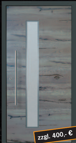
Rohrbach - 1 KK G03 RAL 7016, außen „vintage“ Griff 03040011/G800