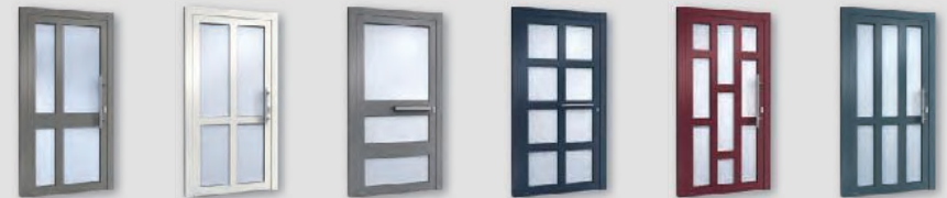
H00202 H00011 H00204 H00031 H00222 H00012