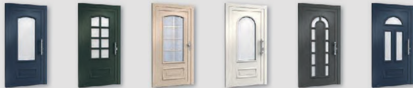
H10323 H10354 H10154 H10339 H10837 H10347