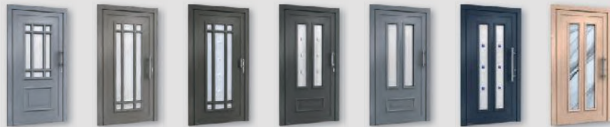
H10754 H11117 H11117 H10315 H10315 H10719 H10719