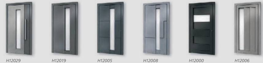
H12029 H12019 H12005 H12008 H12000 H12006