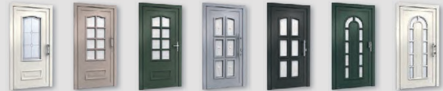
H10371 H10354 H10354 H10763 H10763 H10837 H10837