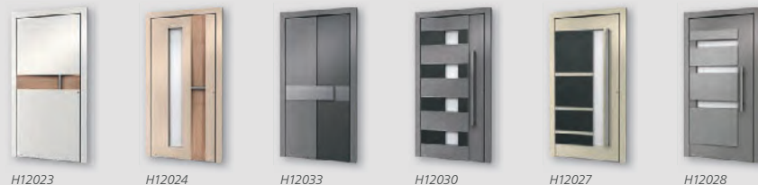
H12023 H12024 H12033 H12030 H12027 H12028

Hinweis: Alle Haustüren sind auch mit passendem Seitenteil in unterschiedlichen Gestaltungsvarianten erhältlich