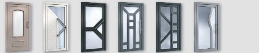
H10323 H00902 H00904 H00919 H00913 H00975