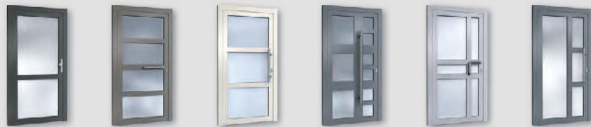
H00010 H00030 H00020 H00212 H00207 H00216

Hinweis: Alle Haustüren sind auch mit passendem Seitenteil in unterschiedlichen Gestaltungsvarianten erhältlich