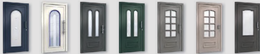
H10232 H10232 H10713 H10713 H11130 H11130 H10371