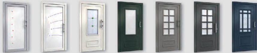
H91100 H91102 H10874 H10874 H10878 H10878 H10754

Die klassischen Türmodelle verbinden elegante, zeitlose Formen mit dekorativen Elementen. Charakteristisch dafür sind die im traditionellen Stil gestalteten Lichtausschnitte, die profilierten und geschwungenen Rähmchen sowie handwerkliche Glaskunst, wie beispielsweise Sandstrahlung, Facetten oder Ornament-Ruten. Jede Klassikür können Sie durch spezielle Ausstattungspakete exakt an Ihre Wünsche und Bedürfnisse anpassen. Sprechen Sie einfach mit Ihrem Fachberater. Er zeigt Ihnen gerne Ihre Möglichkeiten.