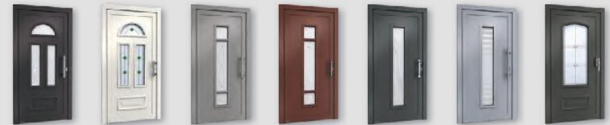
H10347 H10347 H11110 H11110 H11111 H11111 H10323