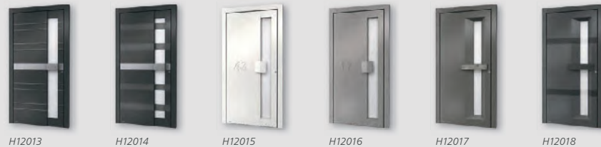
H12013 H12014 H12015 H12016 H12017 H12018

Entdecken Sie die neue Dimension der Eingangsgestaltung: ATRIS-style Türen bieten Ihnen dreidimensionales Design mit besonderer Tiefenwirkung. Scheinbar schwebende Türgriffe, zurückgesetzte Füllungen oder asymmetrische Vertiefungen des Lichtausschnitts sind nur ein paar Beispiele dafür, wie diese Modelle neue Maßstäbe in der Haustürgestaltung setzen. Gleichzeitig bieten ATRIS-style Türen jede Menge Raum für Individualität. Denn jedes Türmodell können Sie über spezielle Ausstattungspakete ganz genau auf Ihre Bedürfnisse in Bezug auf Optik, Sicherheit und Komfort zuschneiden.