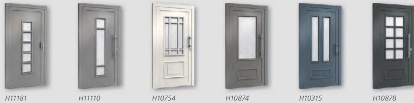
H11181 H11110 H10754 H10874 H10315 H10878

Ein einladender Stil ist keine Frage des Preises. Sondern eine Frage der passenden Tür. SEDOR Klassik-Modelle bieten preisbewussten Qualitätskäufern eine elegante Auswahl ansprechender Designs in zeitloser Optik. Gepaart mit den Vorteilen einer modernen Aluminium-Tür.