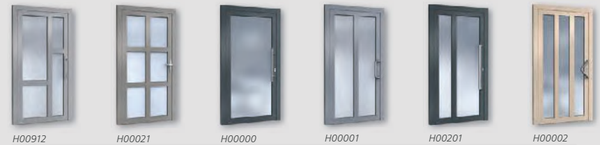
H00912 H00021 H00000 H00001 H00201 H00002

Hinweis: Alle Haustüren sind auch mit passendem Seitenteil in unterschiedlichen Gestaltungsvarianten erhältlich